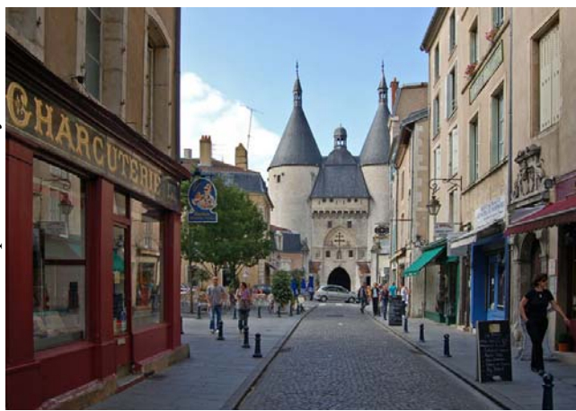
Centre historique de Nancy