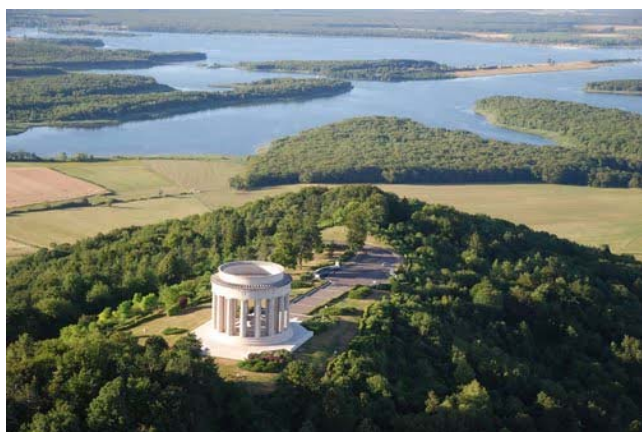
Butte de Montsec

Dans la petite église d' Hattonchâtel se trouve un retable attribué à Ligier Richier.