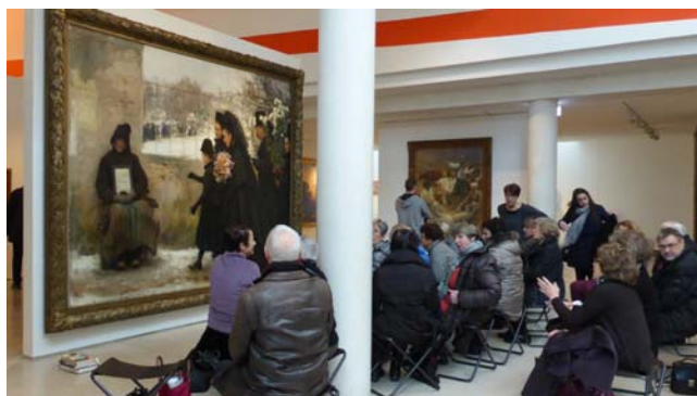
Musée des Beaux-Arts

L'après-midi, un petit train touristique nous fera découvrir le centre historique de cette ville riche en histoire.