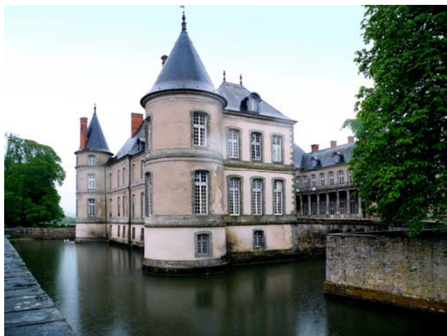
Château de Haroué

Nous enchaînerons par la visite du château de Haroué , le « Chambord lorrain »